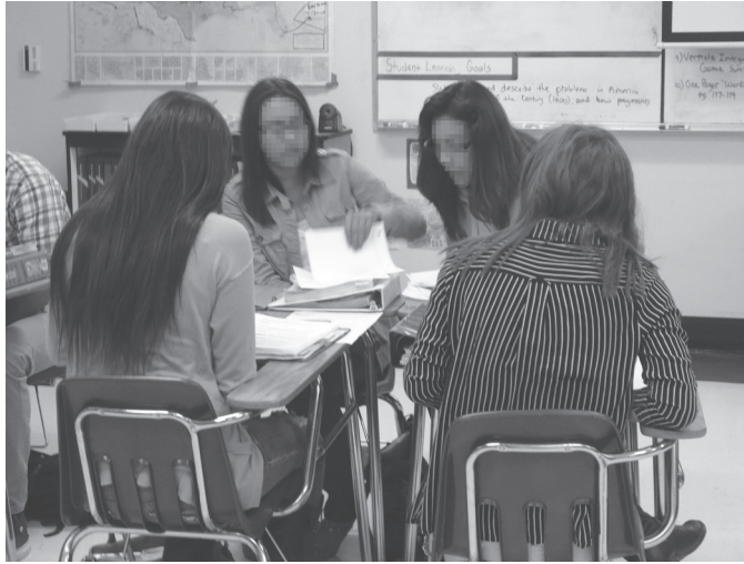
写真2 グループに分かれて熱心に議論する生徒たち